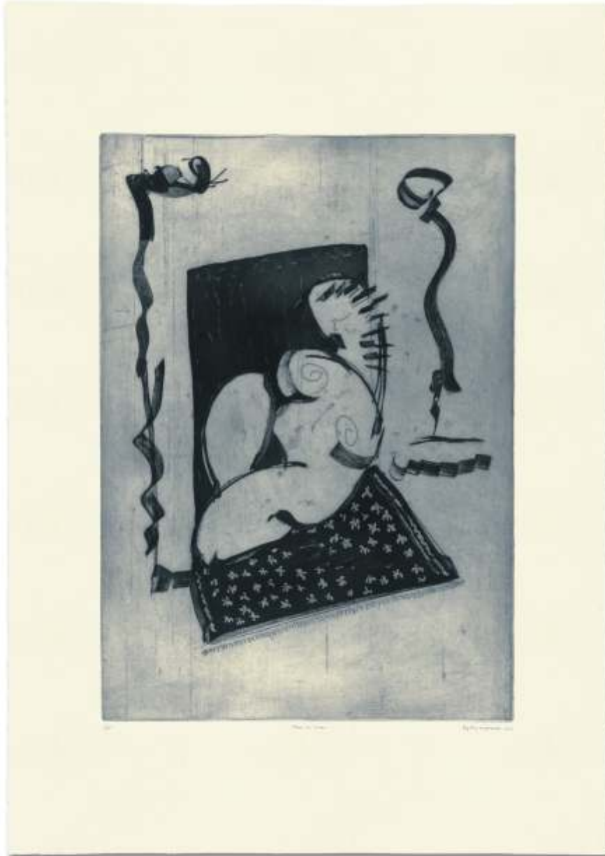
Unter den linden. 2007. Aguafuerte y aguatinta s/ zinc. 100 x 70 cm. Edición de 25 ejemplares