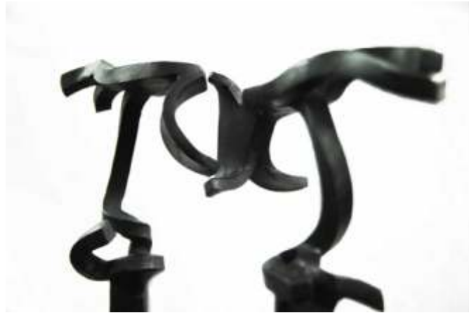
Giverny. 2008. Acero forjado. 98 x 80 x 23 cm.