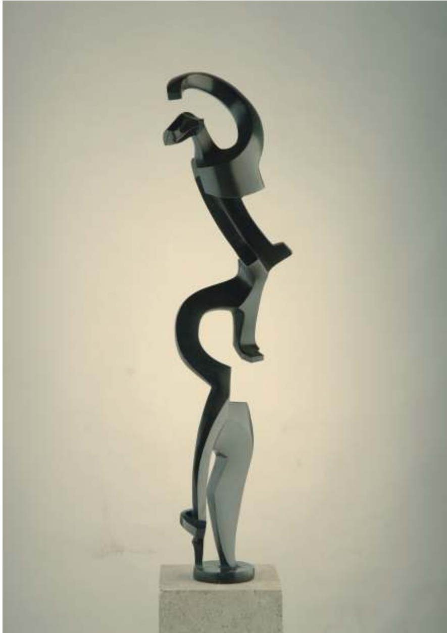
Anitra's dance. 2005. Bronce. 67 x 14 x 13,5 cm. Edición de 6 ejemplares