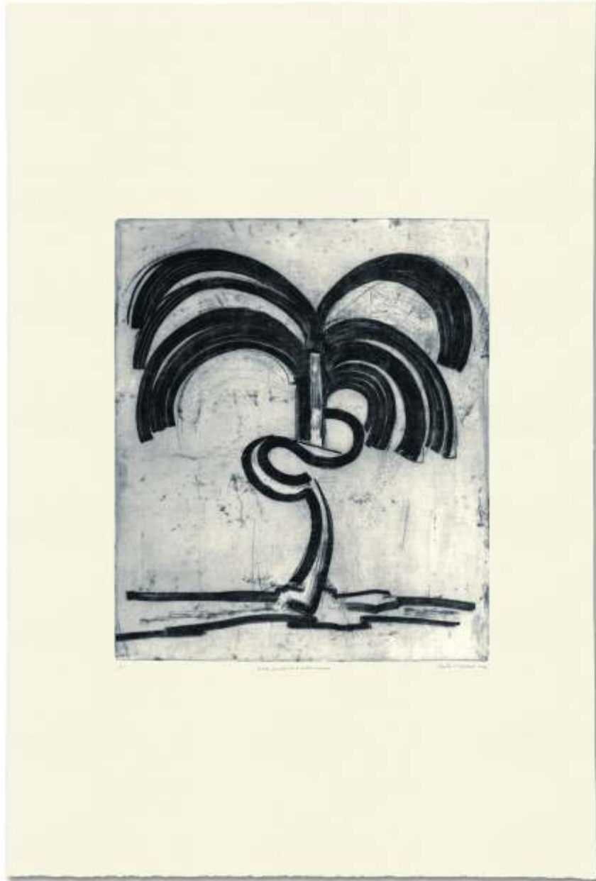
A mato que anda, no le prestes tu sombra. 2006. Aguafuerte s/ zinc. 114 x 76 cm.. Edición de 15 ejemplares