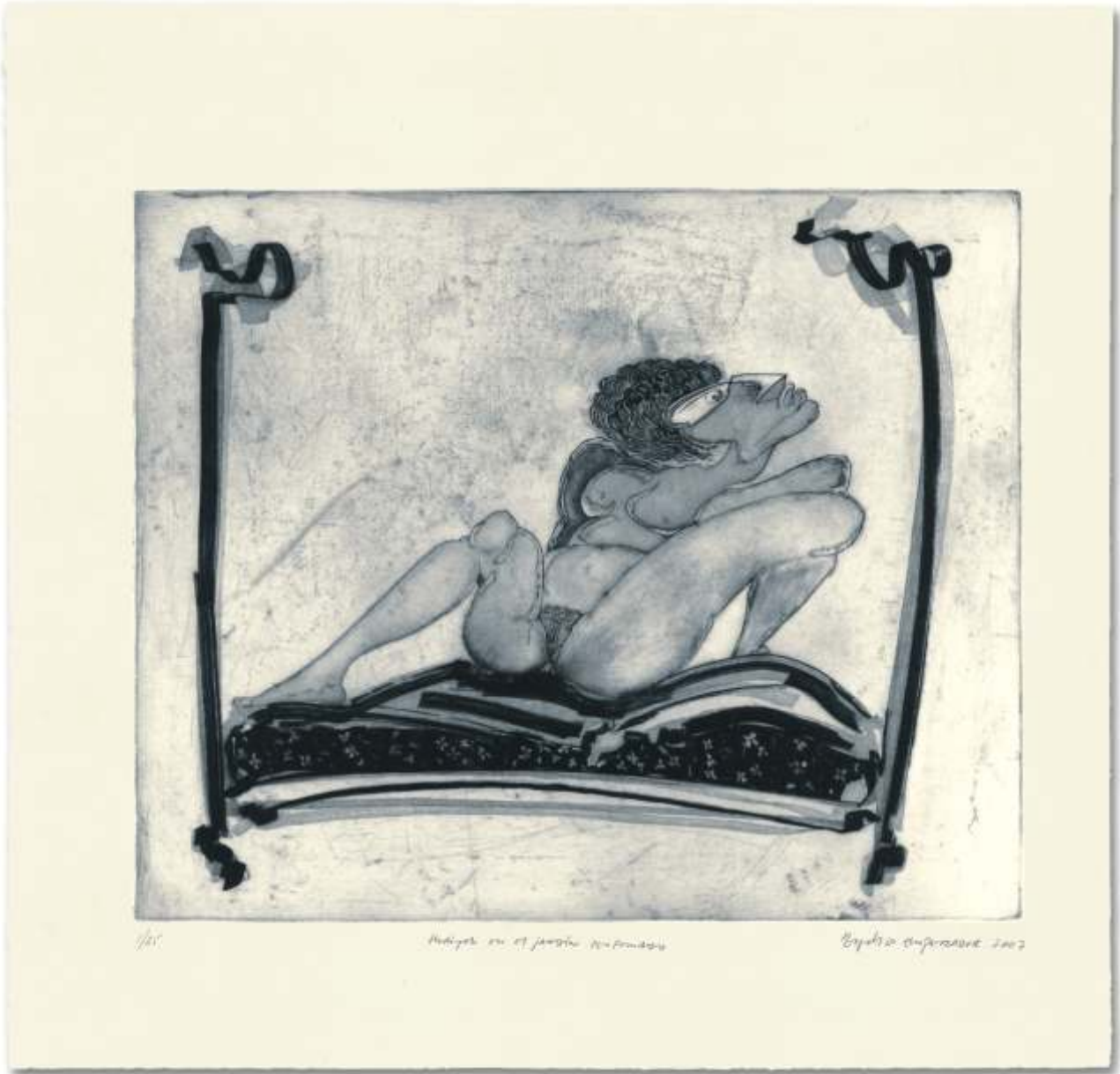
Huriyah en el jardín perfumado. 2007. Aguafuerte y aguatinta s/ zinc. 70,5 x 74,5 cm.. Edición de 25 ejemplares.