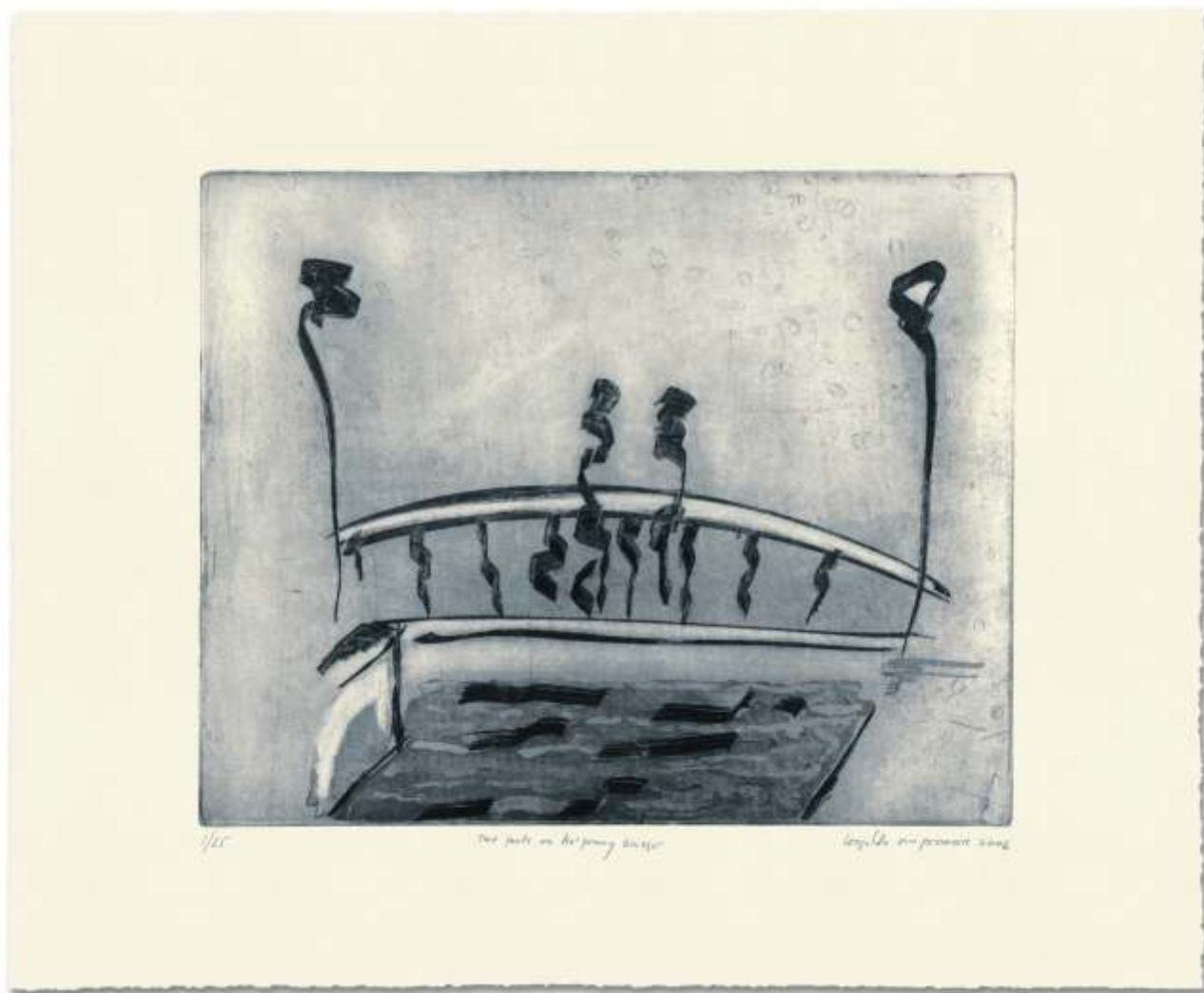
Two poets on Ha'penny bridge. 2006. Aguafuerte y aguatinta s/ zinc.. 57 x 70 cm.. Edición de 25 ejemplares.