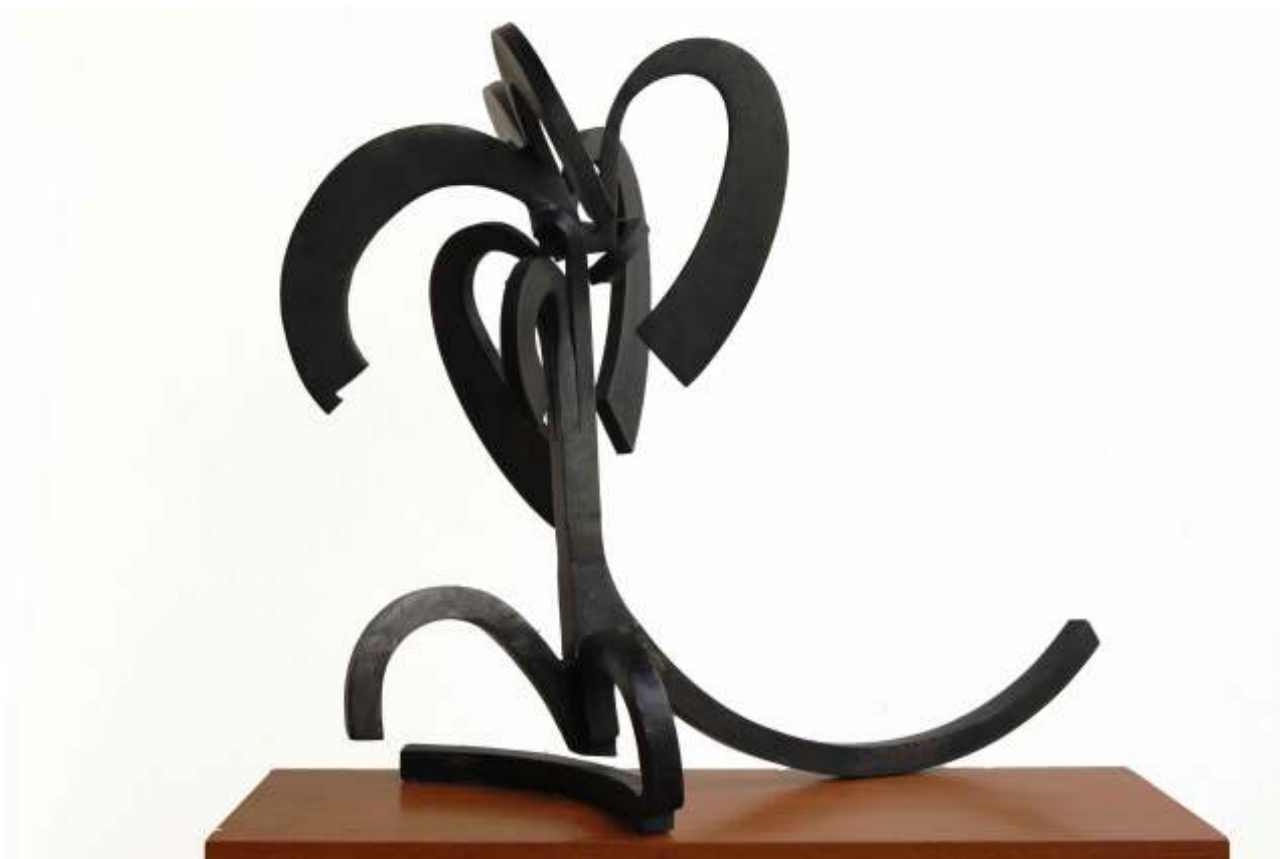
Sicómoro II. 2008. Acero forjado. 47 x 54 x 37 cm