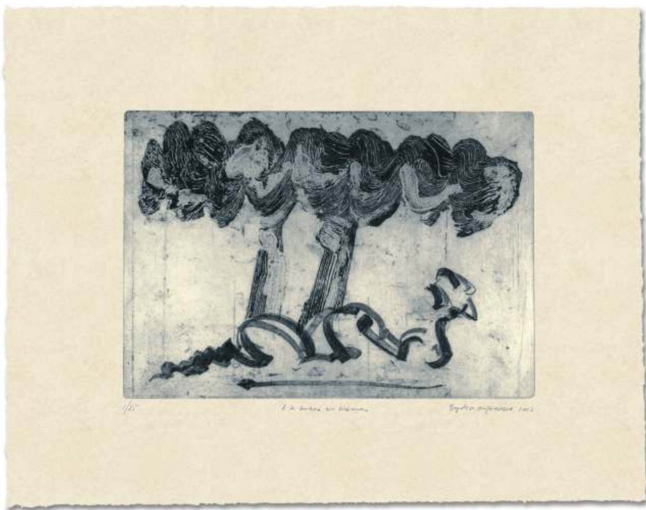
A la sombra del sicómoro. 2007. Aguafuerte s/ zinc. 50 x 63,5 cm.. Edición de 25 ejemplares.