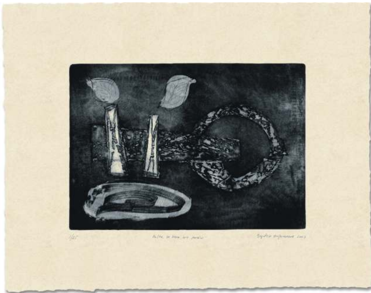
Oculto, la llave del jardín. 2007. Aguafuerte y aguatinta s/ zinc. 50 x 63,5 cm. Edición de 25 ejemplares.